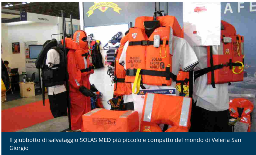
Il giubbotto di salvataggio SOLAS MED più piccolo e compatto del mondo di Veleria San Giorgio

🕒 12 NOVEMBRE 2016 💬 COMMENTI (0) 📁 ACCESSORI, COMPONENTI, METS AMSTERDAM, NEWS, SALONI, SICUREZZA, ULTIMA ORA