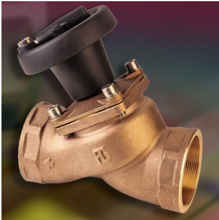
La Valvola Antiblocco 2210 di Guidi

di perdite, non una goccia d'acqua, non una traccia d'umidità.